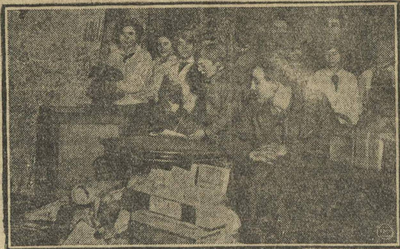
СМЫЧКА ПИОНЕРОВ ГОРОДА С ПИОНЕРАМИ КОЛХОЗОВ СРЕДНЕЙ ВОЛГИ. 21/1—1930 г. в Москве, в клубе бауманских рабочих, открылась 4-я пионерская конференция района. Конференция прошла под лозунгом «Смычка бауманских пионеров с пионерами колхозников Средней Волги». Пионеры подарили колхозникам много подарков: сеялку, племенного бычка-инкубатор, племенных кур, радио-приемники, литературу по колхозному движению и много других подарков. Пионеры города взяли на себя обязательство регулярно помогать колхозникам. На снимке: Общий вид президиума. Момент передачи подарков колхозникам.