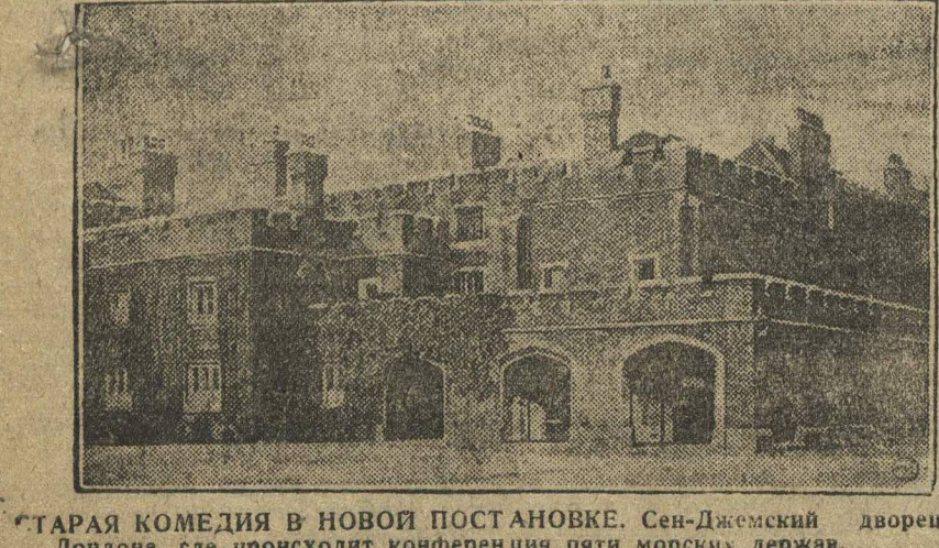
СТАРАЯ КОМЕДИЯ В НОВОЙ ПОСТАНОВКЕ. Сен-Джемский дворец в Лондоне, где происходит конференция пяти морских держав.

Вы, уезжающие в деревню, должны руководить этими колхозами, возглавлять их. Для этого нужно использо-