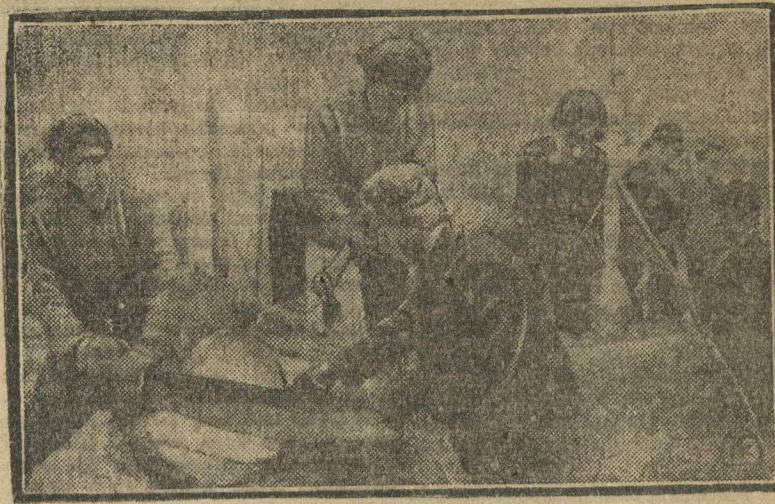
УДАРНИКИ НА ЛЕСОЗАГОТОВКАХ. Во время «рождественских» дней ученики и работники профшколы (Красноборск, Сев.-Двин окр.), организовали ударную бригаду, которая все «рождество» работала в лесу. Такой зажигательный пример удержал лесорубов от празднеств рождества. На снимке: Бригадники за работой.

Бюро коллектива ВЛКСМ зав. имени Колющенко. Гор. Челябинск.