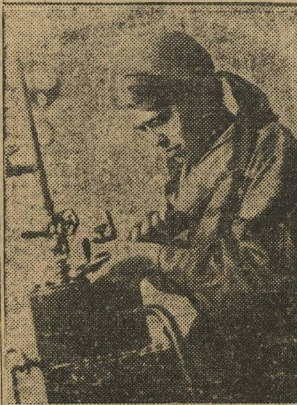
Ученица-ударница ФЗУ «Кр. Сормово» за сборкой паровой машины (механический кабинет).