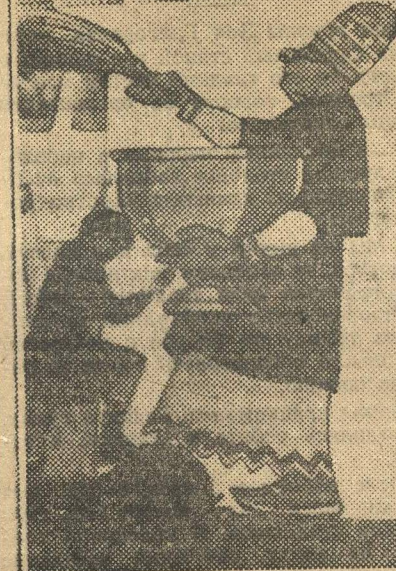
В клубе совторгслужащих готовят карикатуры к первомайскому карнавалу.

По сигналу фабричного гудка, раздававшемуся в 12 час. дня, со всех сторон начали стекаться к зданию министерства юстиции группы рабочей молодежи с красными знаменами. Раздался выкрик протеста против смертных приговоров.