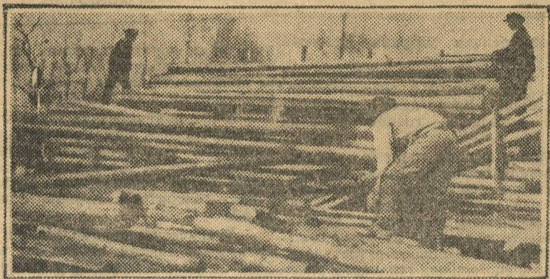
Метод ударничества проникает на все участки социалистического строительства. На снимке: ударники на лесозаготовках.

На собрании городского актива о необходимости участия комсомола в социалистическом соревновании говорилось много. После доклада собрание приняло резолюцию о задачах, стоящих перед комсомолом в связи со смотром. В резолюции говорилось очень много пышных фраз. Всего резолюция имела 24 пункта. Но о проведении их в жизнь райком комсомола не беспокоился и не беспокоится.