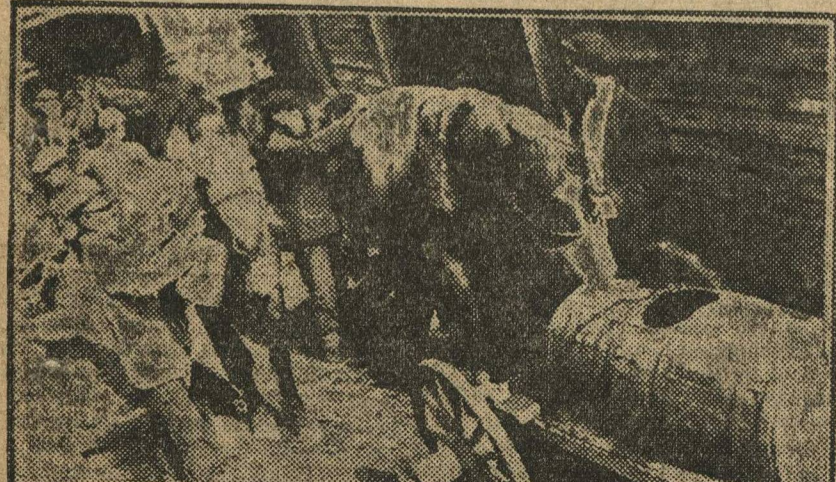
Перед выездом в поле колхозники поят лошадей.

Вторым идет совхоз «Большевик» (Арзамасского округа), выполнивший план сева ранних культур на 86 проц.