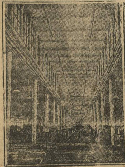
Сталинградский тракторный завод

Уже солнце садилось, когда этот товарищ поднялся, чтобы продолжать свое путешествие. Долго думал я об этом храбром классовом борце, который, едва почувствовав себя в безопасности после побега, вернулся опять на разработки селитры, чтобы в ряды нелегальной сейчас коммунистической партии Чили вновь бороться за освобождение чилийского пролетариата.