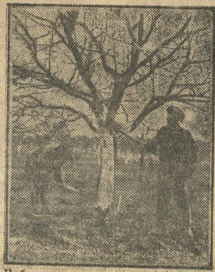
Побелка стволов яблоней известью.

Молодым садоводам Мореновской школы приходилось сажать деревья только в крестьянских огородах. На участках земли, скованных плетнями и частокладами, прекрасная теория о шахматном порядке разбивалась в прах. Мужики-собственники заставляли сажать яблони часто, как картошку, соблюдая единичный принцип, — занять как можно меньше места. Посаженное так дерево заранее было обречено на жалкое прозябанье, на ревматизм и подагру сучьев, на худосочие и бледную немочь плодов.