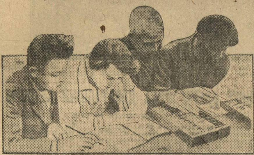
Колхозные школы готовят счетоводов для колхозов.