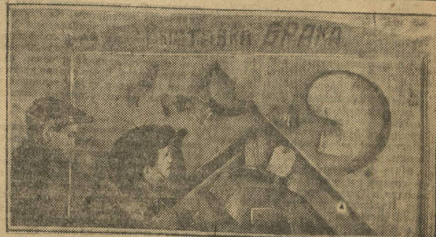
Выставка брака цеха сельхозмаши в столовой завода «Гудок Октября» (Канавино).

На бумаге все хорошо. Ударным движением охвачены поголовно все комсомольцы, а фактически далеко не все благополучно, как думает райком.