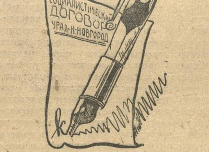
«Подписано и с плеч долой...»

суджался только на секретариате, за кружки физкультуры о нем до сих пор не знают.