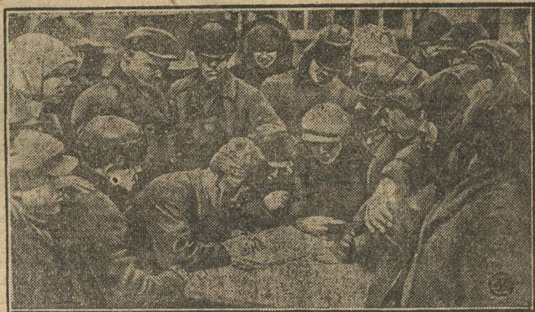
Колхозники вступают в партию.

В области социалистической реконструкции сел. хозяйства, несмотря на ряд крупнейших недочетов и существенных ошибок в работе парторганизаций, повлекших за собой частичный срыв планов коллективизации, парторганизация добилась значительного продвижения вперед, имея на 1 мая в кол-