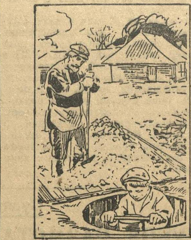
Приготовление коровьей капусты (силосование).

Засуча рукава, с лопатами в руках, будем творить животноводческую революцию!