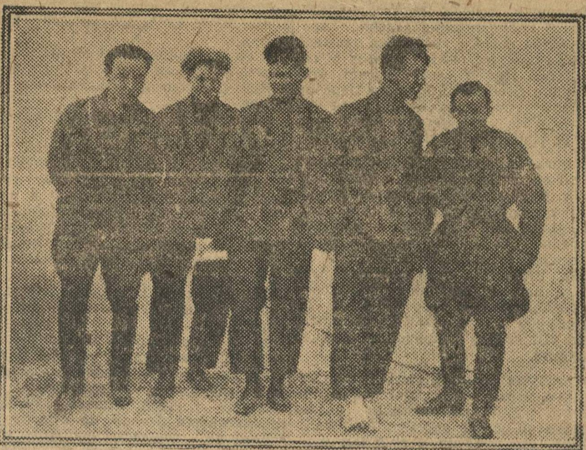
Делегаты Нижегородской краевой партконференции идут на заседание.

Работающей сейчас второй краевой партийной конференции комсомол края даст слово, что он усилит свое участие в перестройке сельского хозяйства и что в приближающейся кампании сева озимых будет участвовать еще более активно, чем это было весной.