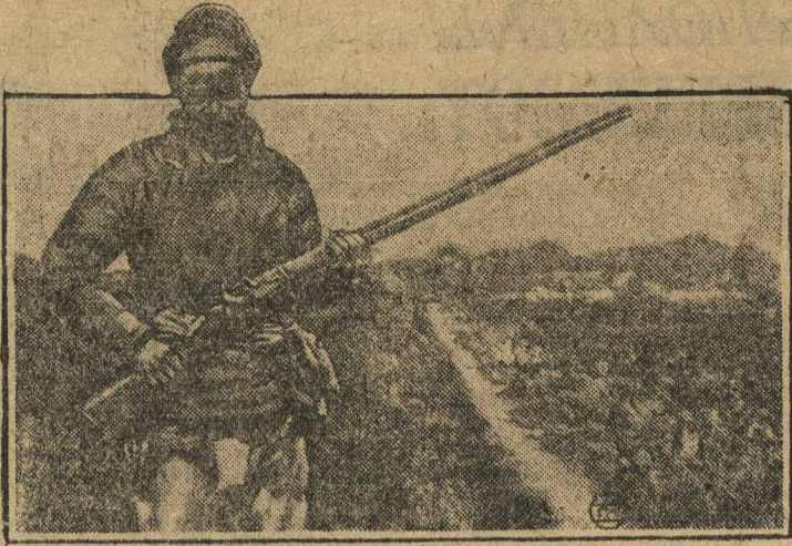
КРАСНЫЕ ВОЙСКА В КИТАЕ. На снимке: тип китайского повстанца—расноармейца.