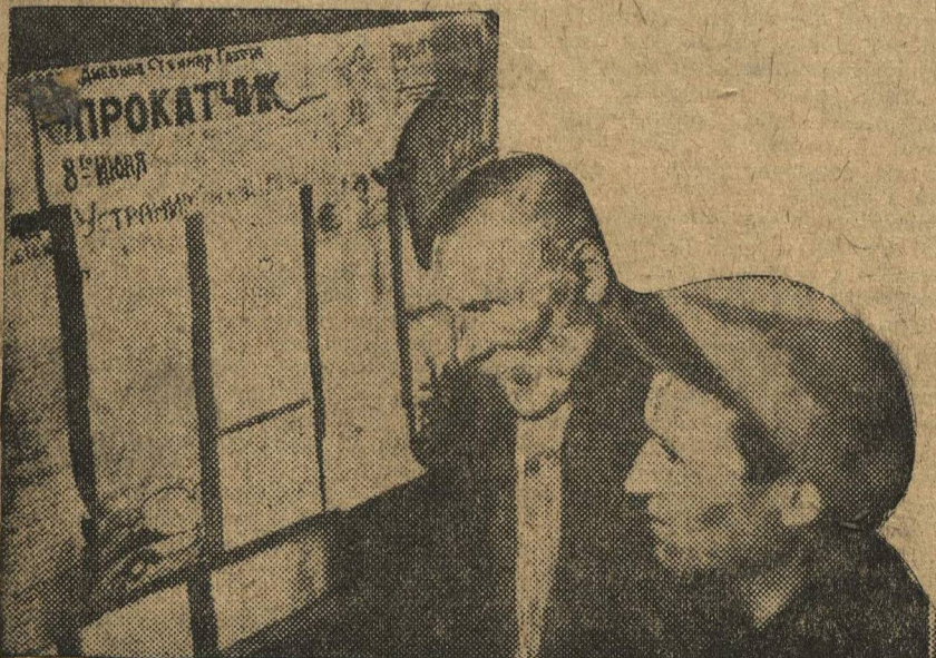
«ПРОКАТЧИК» ежедневная стенгазета рабочих железо-прокатного цеха завода «Кр. Сормово». Опыт выпуска ежедневной стенгазеты первый в Крае.