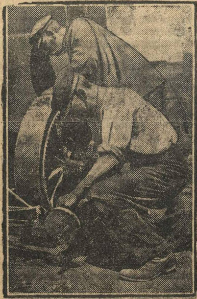
Выпуск средств производства в нашей стране увеличивается. На снимке—рабочие за сборкой новой машины.

Наши задачи в связи с походом: добиться большей эффективности от него и опыт похода перенести в другие организации края.