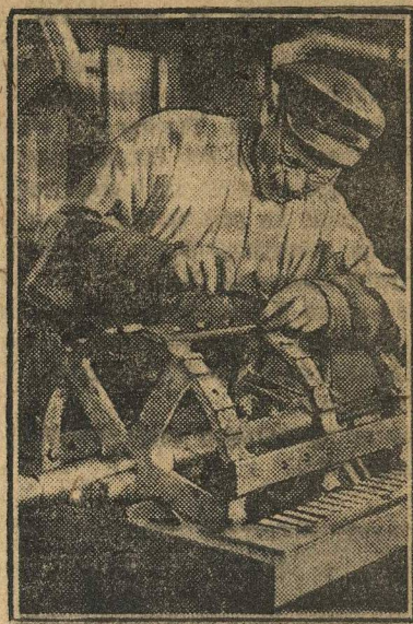
Ударник повышает темпы своей работы.

ваний. Бригады будут проверять выполнение директив директора и фабкома, а также степень реализации рабочих предложений.