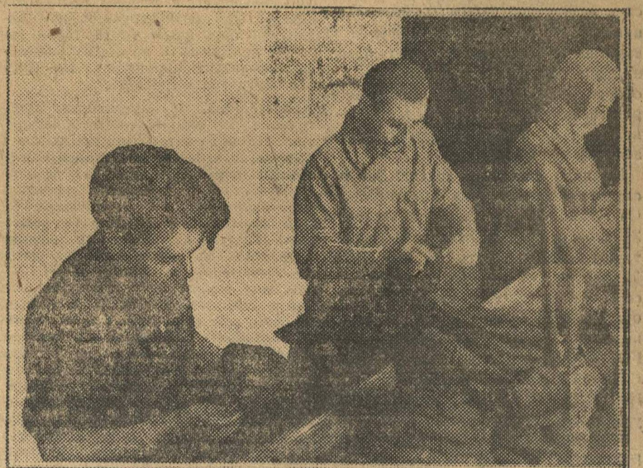
Вновь организованная молодежная бригада-коммуна в цехе головных уборов фаб-ки Швейпрома.