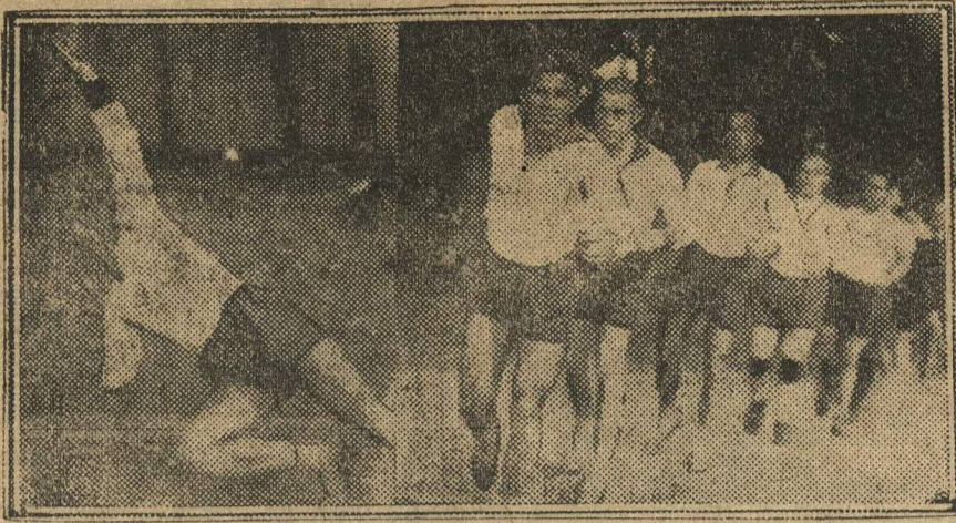
Нижегородское спортивное общество «Динамо» для участия в эстафетном кроссе в честь юбилея «Ленинской Смены» (1 июля) выставляет целую команду. Сейчас идет усиленная подготовка. На снимке: моменты тренировок.

МОЛОДЕЖЬ ДЕРЕВНИ, газета идет от тебя живых рассказов, стихов, частушек о жизни деревни, о работе колхозов, комсомола