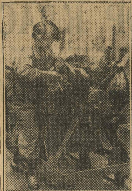
Практикантка-ударница из индустриального техникума за сборкой мотора на автосборочном заводе.

КрайРКИ установить строжайший контроль за своевременной постройкой общежитий, приспособлением под общежитие отведенных зданий, своевременным использованием отпущенных на эту цель средств.