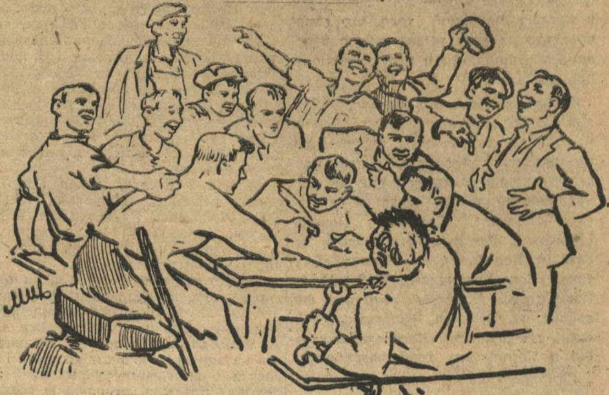
ИЖЕВЦЫ ПИШУТ ОТВЕТ СОРМОВИЧАМ.