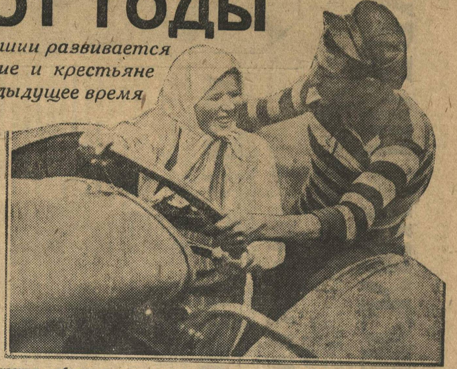
Чувашка, забитая прежде, сегодня в первых шеренгах бойцов за социализм.

Все эти показатели роста Чувашской автономной республики бьют не только по ушам, а по глазам тем правым уклонистам, которые утверждали о социальном перерождении чуваш, о том что будто чувашам Октябрьская революция ничего не дала, о том, что сельское хозяйство Чувашии идет на вперед, а к упадку... К. Калинин.