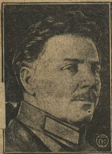
Тов. ВОРОШИЛОВ. Член президиума XVI съезда партии.