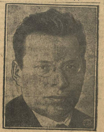
Тов. РУДЗУТАК. Член президиума XVI съезда партии.

На районном совещании актива, состоявшемся в Доме Культуры, совместно с иностранными гостями, постановлено: поручить звякому заводу «Красное Сормово» и 26 бакинских коммунаров» выделить 4 рабочих для поездки в Москву — передать рапорт XVI съезду ВКП(б).