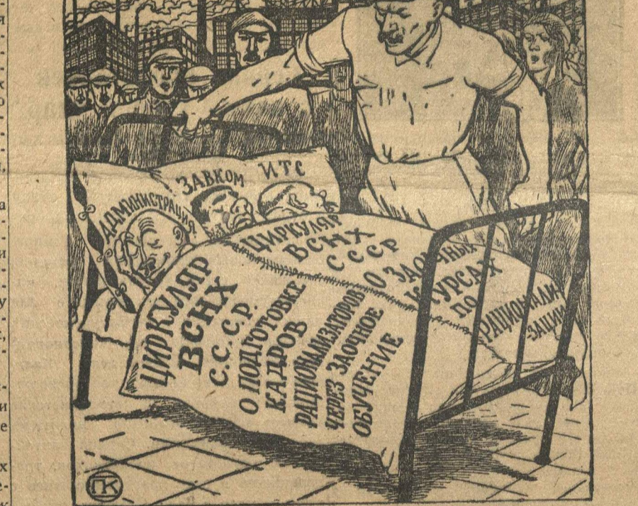
ПРОСИТЕСЬ! МЫ ЖАДЕМ УЧЕБЫ