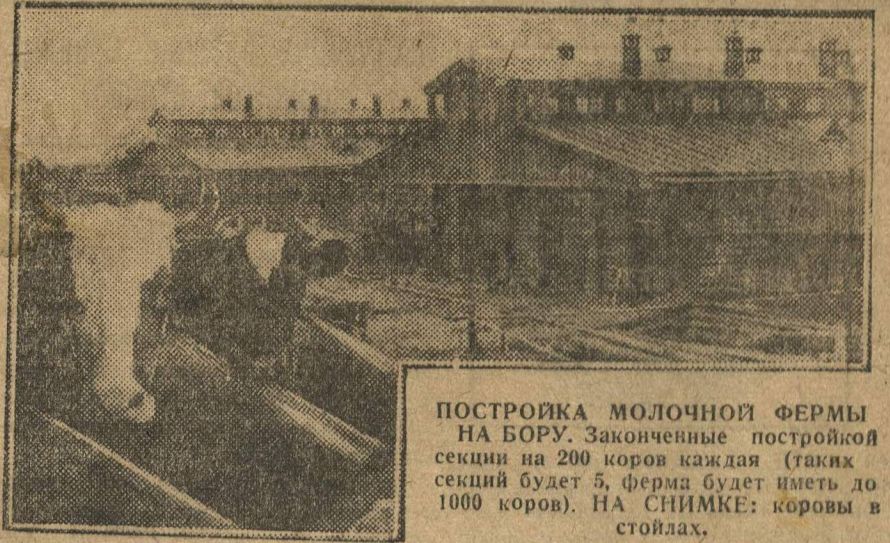
ПОСТРОЙКА МОЛОЧНОЙ ФЕРМЫ НА БОРУ. Законченные постройкой секции на 200 коров каждая (таких секций будет 5, ферма будет иметь до 1000 коров). НА СНИМКЕ: коровы в стойлах.