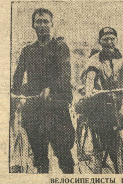
ВЕЛОСИПЕДИСТЫ ПЕРЕД СТАРТОМ...