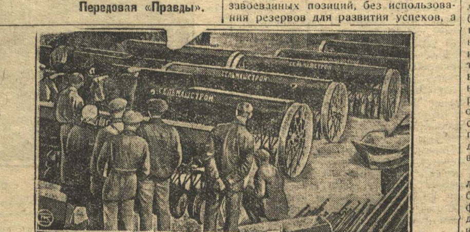
Завод-гигант Сельмаш в гостине-на-Дону начинает работу. На снимке: первая партия сеялок, выпущенная заводом.

Наша партия не позволит правым уклонистам, этой агентуре кулачества внутри партии, «отвязываться» и «выжидать момента». Брыжля оппортунистическая — таково общее требование всех слоев партии и всего рабочего класса. Этого требует успешное проведение разностороннего социалистического наступления по всему фронту народного хозяйства.