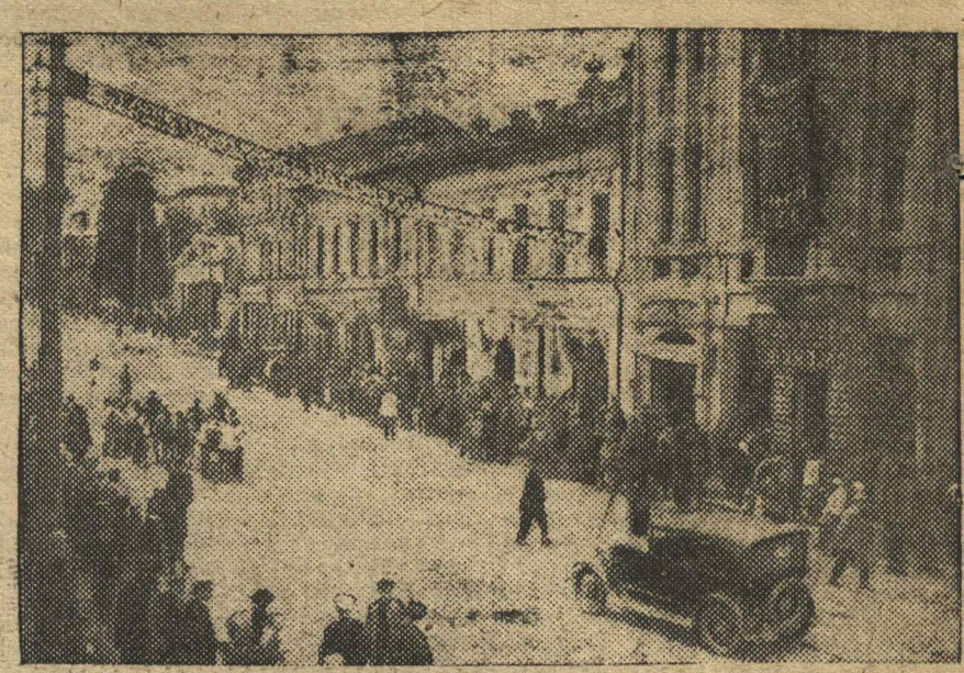
НА ВТОРОМ ЭТАПЕ, У РЕДАКЦИИ „ЛЕНИНСКОЙ СМЕНЫ“, В ОЖИДАНИИ ВЕЛОСИПЕДИСТОВ...

На старт аккурратно явились команды Свердловского района. Из-за опоздания команды Балавинского района старт был дан позднее на 10 минут. К финишу пришла Свердловская команда.