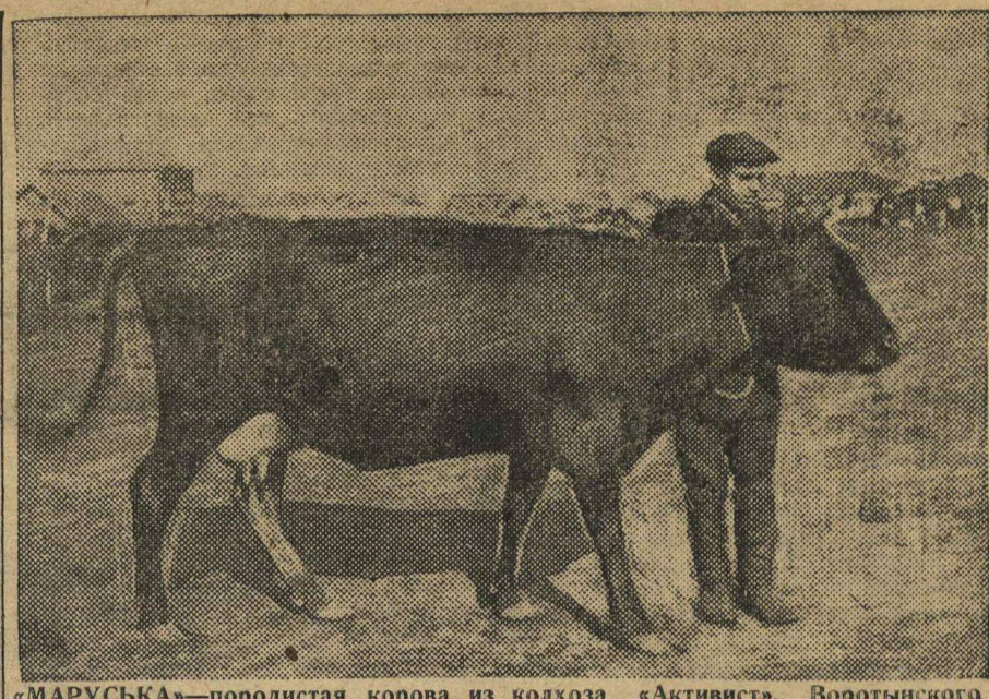
«МАРВУСЬКА»—породистая корова из колхоза «Активист», Воротынского района, Нижегородского округа. Одна из лучших на сельскохозяйственном выставке.

Вятский окружной комитет должен немедленно проверить, что делается на местах, решительно двинуть дело вперед.