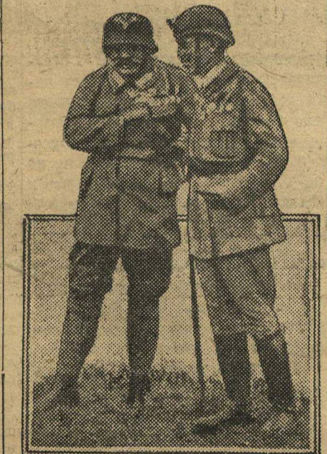
Германские фашисты, те что подготавливают свой приход к власти (читай статью на 2-й стр.).