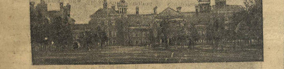
Общий вид Юринского дворца с северной стороны.

селецкого совета средства на содержание коменданта дворца и теперь дворец «без хозяина». Постановка вопроса о дворце в областных органах вообще получает бюрократическое от-