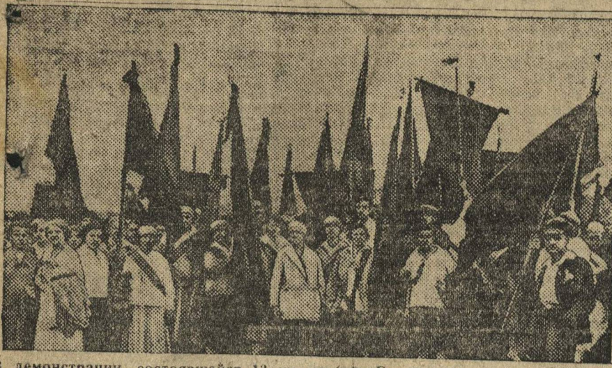
В демонстрации, состоявшейся 13 июля (под Берлином) участвовало свыше 100 тысяч пролетариев.

Ячейке нужно перестроить свою работу, каждому комсомольцу дать конкретную работу по строительству, показав перспективы стройки. Нужно заняться борьбой своего завода, быть единой ударной бригадой организующей остальных рабочих. Райком ВЛКСМ должен помочь ячейке в этом. П. Ил—ин.