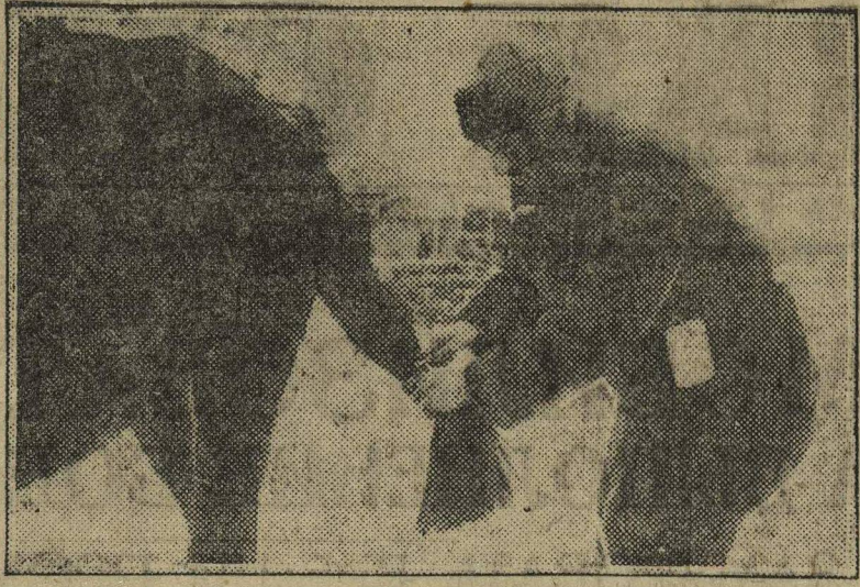
Лошадиные хвосты для экспорта. Крестьянин отрезает хвост у колхозной лошади.

ОБЩЕЕ ПОЛОЖЕНИЕ с силосованием таково, что, несмотря на ряд мероприятий сверху, мы стоим перед невыполнением плана создания кормовой базы для укрепления социалистического животноводства страны. Вот факты: по данным ОблЗУ ЦЧО, план выполнен только на 0,2 проц. Перелома в работе по силосованию нет ни на Северном Кавказе, ни на Волге, ни в Ленинградской, ни в других областях СССР. Еще хуже обстоит дело с капитальным силосо-строительством. Силосных башен намечено было построить 2000, а на 10 августа Совхозстрой обзавелся дать только 650, причем «гарантирует» только 570. ДАЖЕ МИНИМУМА в капитальном строительстве мы не имеем. Вместе с этим чрезвычайно характерны такие явления. У многих земработников имеется явно выраженное «ГОЛОВОКРУЖЕНИЕ ОТ СОЛОМЫ», вызванное хорошим урожаем хлебов на Северном Кавказе и Украине.