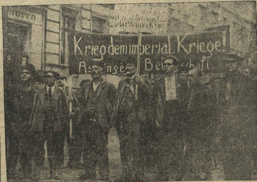
Рабочие завода Аппингер (Берлин, Германия) на первоавгустовской демонстрации.

ПРАГА. Чехо-Словацкая газета «На-родни Освобоzeni» пишет, что шум вокруг советского экспорта—результат недостаточно критического отно-шения к тому, что происходит в СССР. По мнению газеты, не выдерживает критики попытка представить дело так, что экспорт по низким ценам — исключительно советское явление. Га-зета указывает, что значительная часть Чехо-Словацкого экспорта ос-нована на демпинге (например, сахар вывозится по ценам, составляющим 40-45 проц. его сырьевой стоимости и т. д.). «Так же пишет газета,—об-стоит дело и в других странах. «Не-верно также,—продолжает газета,—что дешезина советских товаров якобы достигается сужением жизненного уровня рабочего класса СССР. Надо помнить о громадной разнице издер-жек производства в нашей лесной промышленности и лесной промышлен-ности СССР, располагающего необ-ходимыми девственными лесами и удоб-ными и дешевыми сплавными путями. Вот причина, сравнительно низкий цен, по которым СССР выбрасывает некоторые свои товары и сырье на внешние рынки. Этому на помощь приходят еще системы планового хо-зяйства и монополия внешней торго-вли, которых лишены другие государ-ства».