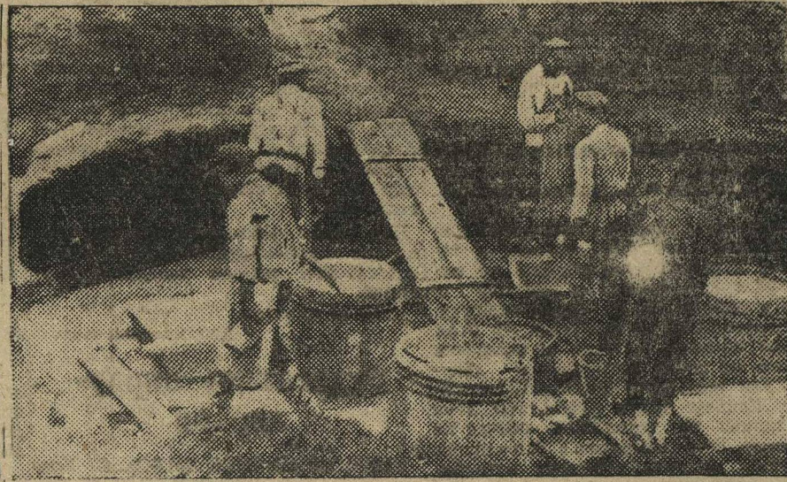
Опытное хозяйство имени Карла Либкнехта (Ниж. округ). Устройство силос-ной ямы.