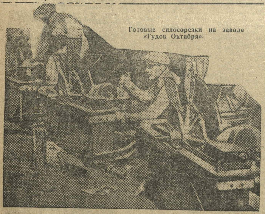
Готовые силосорезки на заводе «Гудок Октября».

Возмущение и недоверие рабочих оправдалось в тот же день, когда бюро комсомольской ячейки, на «заочный» ремонт и оборудование сделало свой боевой комсомольский налет.