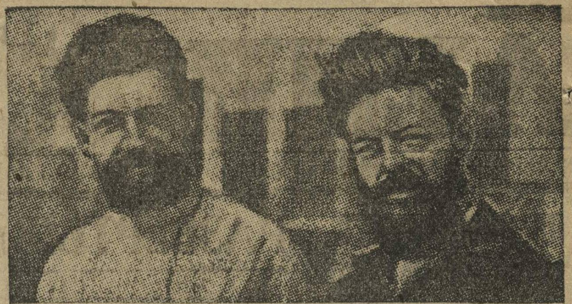
На лесоразработках в Северном крае работали московские комсомольцы. Они показали много примеров трудового героизма. На снимке, двое комсомольцев перед возвращением в Москву.