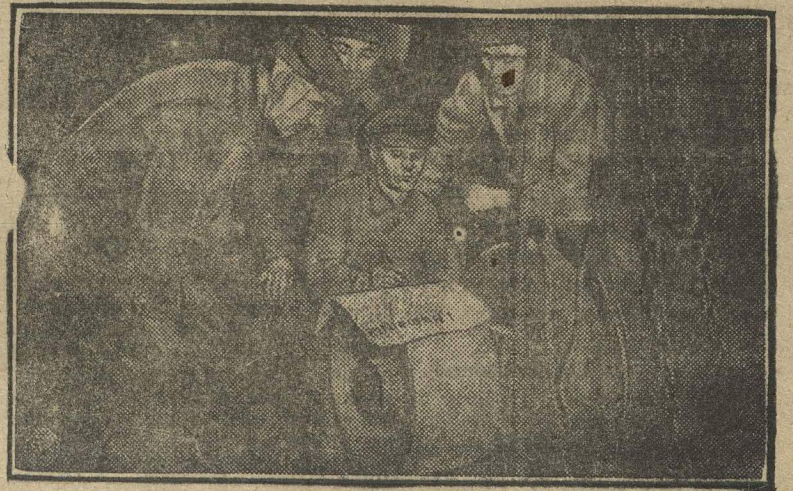
Обсуждают вызов днепрпетровцев о «займе рабочих предложений».