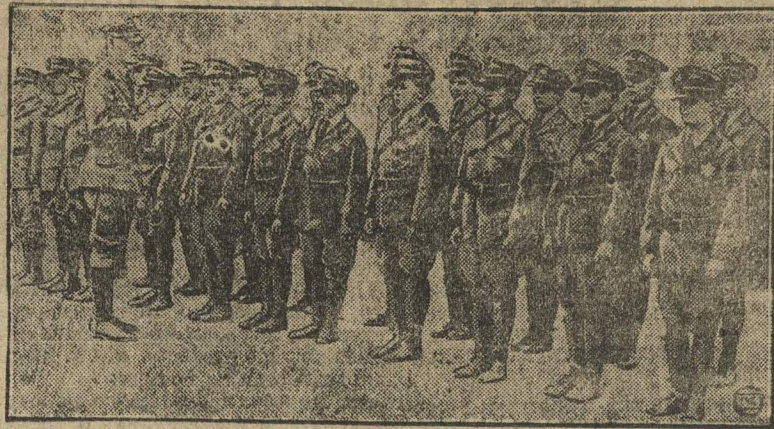
Дети-полицейские в демократической Америке (Нью-Йорк). Небывалый, все растущий кризис народного хозяйства САСШ вызвал сильное брожение среди трудящихся масс. Буржуазия, не желая быть застигнутой врасплох, готовит себе резервы, обучая детей полицейскому искусству. На снимке: смотр детей, будущих полицейских.

4-й конгресс состоялся в марте 1928 г. в Москве, когда уже выявились катастрофические последствия для пролетариата капиталистической рационализации. С другой стороны, конгресс совпал с началом вступления СССР в реконструктивный период. Одновременно в капиталистических