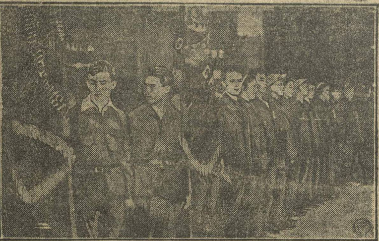
Общемосковский слет ударников. На снимке: рапорт комсомольцев ударников завода АМО.

Избирательные комиссии формируются исключительно из фашистов, членов буржуазных партий, а также социал-демократов. Кампания находится под руководством фашистских организаций и буржуазного блока. Социал-демократы прикрывают фашистский террор и стремятся к объединению на выборах с буржуазными партиями.