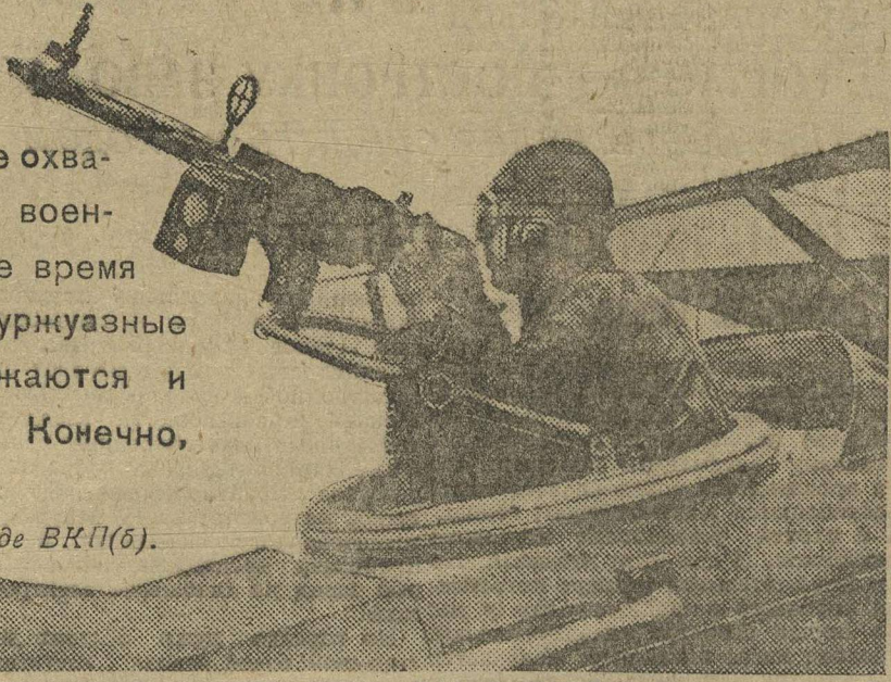
АМЕРИКАНСКИЙ ИМПЕРИАЛИЗМ «РАЗОРУЖАЕТСЯ».

(Сталин. Из доклада на XVI съезде ВКП(б).)