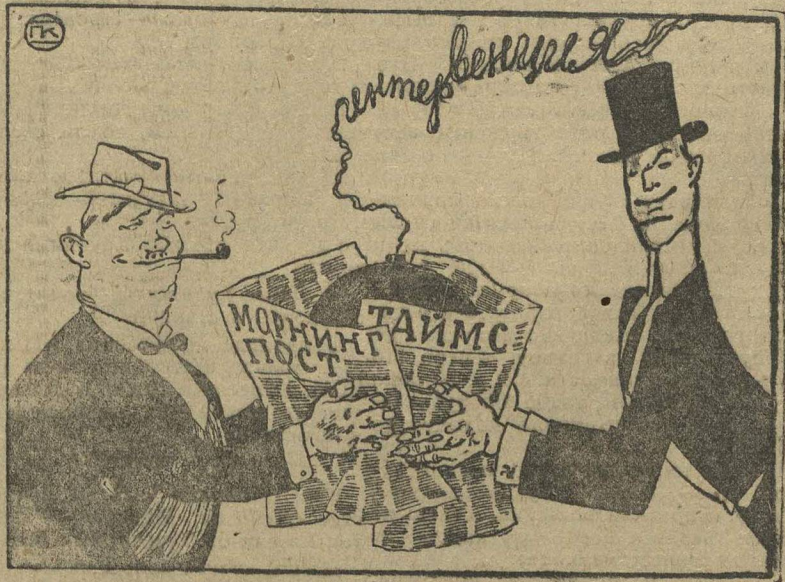
«МИРНЫЕ» ПРЕДЛОЖЕНИЯ АНГЛИЙСКОЙ БУРЖУАЗНОЙ ПЕЧАТИ... № 191

Английская буржуазная печать ведет усиленную подготовку к интервенции, подчеркивая «необходимость восстановления порядка и цивилизации в Китае».