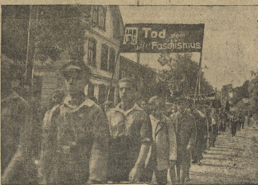
Германские комсомольцы на демонстрации.

Организационное совещание по проведению «Детского дня индустриализации» состоится в Думе работников просвещения 21 августа, в 12 часов дня. На совещание приглашаются вожаки отрядов, представители школ Большого Нижнего-Новгорода и по одному представителю от Дзержинска и Балахны.