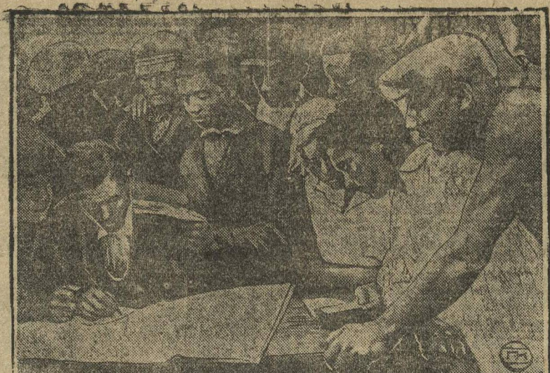
РЕАЛИЗАЦИЯ ЗАЙМА «ПЯТИЛЕТКА—В ЧЕТЫРЕ ГОДА» В СОВХОЗАХ И КОЛХОЗАХ. УРАЛЬСКАЯ ОБЛАСТЬ. НА СНИМКЕ: КОМСОМОЛЬЦЫ И МОЛОДЕЖЬ ПЕТУХОВСКОГО ЗЕРНОСОВХОЗА ЗА ОБСУЖДЕНИЕМ ВОПРОСА О РЕАЛИЗАЦИИ ЗАЙМА СРЕДИ РАБОЧИХ СОВХОЗА.

Из-за плохой подготовки к проведению субботника, субботник в затоне Разнежье провалился во вине профсоюзных и хозяйственных организаций. В нем участвовало только 50 проц., да из них половина учли с субботника. У.