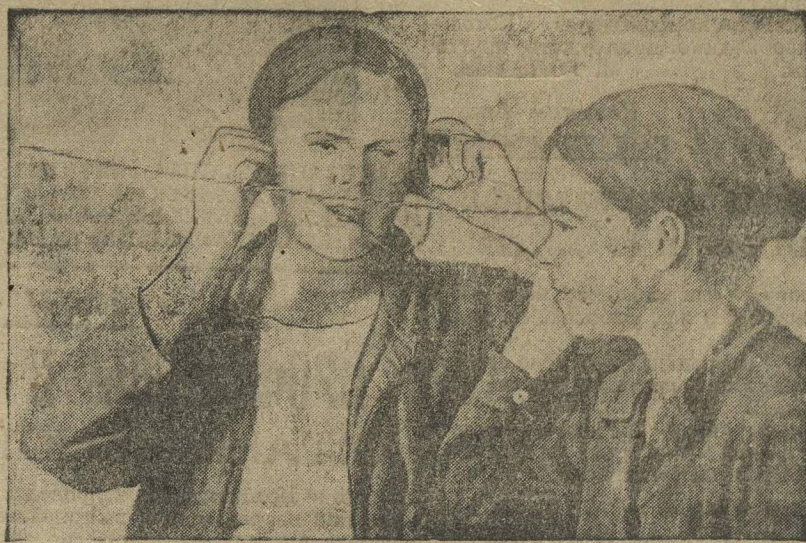
АЛЛО! ГОВОРЯТ О КОЛХОЗНО-ПРОИЗВОДСТВЕННОМ ПОХОДЕ.

Скоро и от остальных колхозов Мар-Посадского района будут прибывать красные обозы, но райпо еще спит. У райпо нет склада, а который есть, требует капитального ремонта. Для ремонта нет лесоматериалов. Райпо запросил лесоматериал от леспромхоза, но пока еще нет результатов. На складах нет приемщиков, не хватает счетоводов. К приему нового урожая у Мар-Посадского райпо 3.000 мешков требуют починки, но кто и когда починит их—это пока еще неизвестно. КТОМАС.