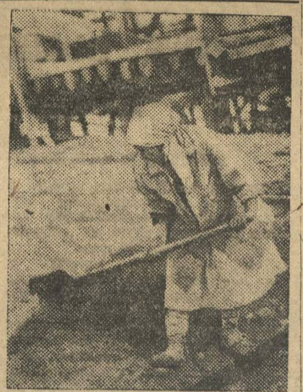
ГЕРОИ ВЫСОКИХ ТЕМПОВ. АВТОСТРОЙ. БРИГАДИЦА ИЗ БРИГАДЫ КОМСОМОЛЬЦА ПЕРЕХОДНИКА.

Хорошим сотоварищем кузнечному—оказался паровозный цех. Три мотора, назначение которых приводить в действие 56 станков, обслуживают 11. Из административного состава в цехе никого на месте не оказалось. Мастер заменял строгальщик. Чернорабочие