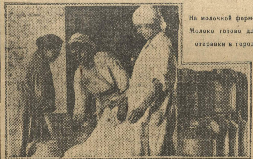
На молочной ферме. Молоко готово для отправки в город

Адрес на представление заявок: Н.Новгород, почта № 1, ящик 33, Агробиостанция Крайбюро ДКО при Крайкоме КСМ.