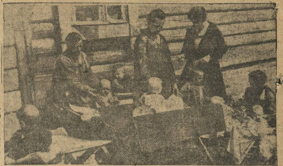
ДЕТИ КОЛХОЗНИКОВ В ЯСЛЯХ. (СЕЛЬСКО-ХОЗЯЙСТВЕННАЯ АРТЕЛЬ «НОВАЯ ЖИЗНЬ», БОГОРОДСКОГО РАЙОНА).

ЗАВТРА, С ЗАВОДА «КР. СОРМОВО», НА СУББОТНИК ИНДУСТРИАЛИЗАЦИИ ПО ЛИКВИДАЦИИ ПРОРЫВА НА ГИДРОТОРФ ВЫЕЗЖАЮТ 15 КРУПНЫХ ЦЕХОВ ПАРОВОЗНОГО И СУДОСТРОИТЕЛЬНОГО ОТДЕЛОВ. СЕГОДНЯ ПОСЛЕ РАБОТЫ ОРГАНИЗУЮТСЯ МАССОВЫЕ МИТИНГИ ПОСВЯЩЕННЫЕ ПРОВЕДЕНИЮ ЗАВТРАШНЕГО СУББОТНИКА НА ГИДРОТОРФЕ.