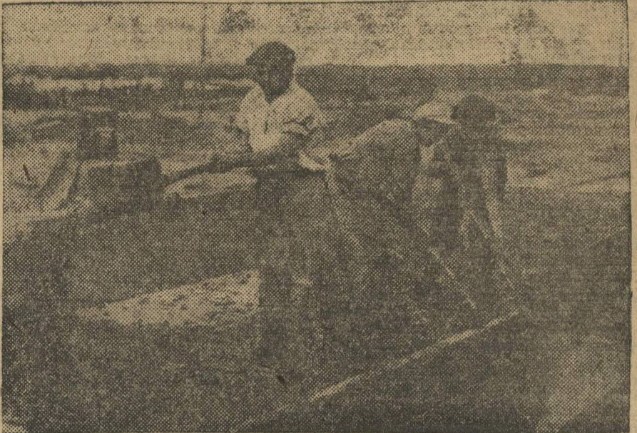
АВТОСТРОЙ. БРИГАДА КОМСОМОЛЬЦА ПЕРЕХОДНИКА