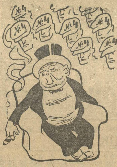
Кошмарный сон германского капиталиста.

Рабочие Германии обещают голосовать на выборах в рейхстаг за список № 4 (список компартии).