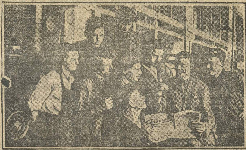
На снимке: Ударная бригада имени XVI МЮД. В центре старые рабочие-почетные бригадиры.

Логика этой «теории» приводит к заявлению о том, что «в 1930—31 году задание (по подготовке кадров. К. З.) не будет выполнено, ввиду отсутствия достаточных школ в прежние годы» (стр. 122, 5-летки МАО). И это пытаются доказать цифрами. «Учебные профессиональные мастерские внутри области должны дать в конце пятилетки 970 единиц, школы ФЗУ — 150 единиц (стр. 10 пятилетки). Эта цифра, очевидно, вытекает из заявления о том, что «стабильность рабочих на существующих предприятиях не дает возможности дальше расширять ФЗУ, т. к. уже сейчас броня подростков перевыполнена (план ОСНХ), а новые