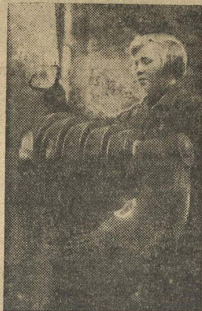
КОМСОМЛКА ЗА СТАНКОМ.