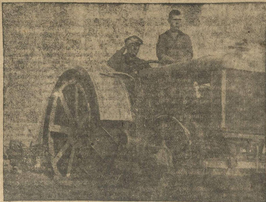
На железном колхозном коне. На поле коллектива «Пробуждение», в Кстовском районе.

Комсомольцы механического завода в Подольске организовали три сквозных бригады ударников имени Международного Юношеского дня. Снимок изображает молодых ударников за работой.