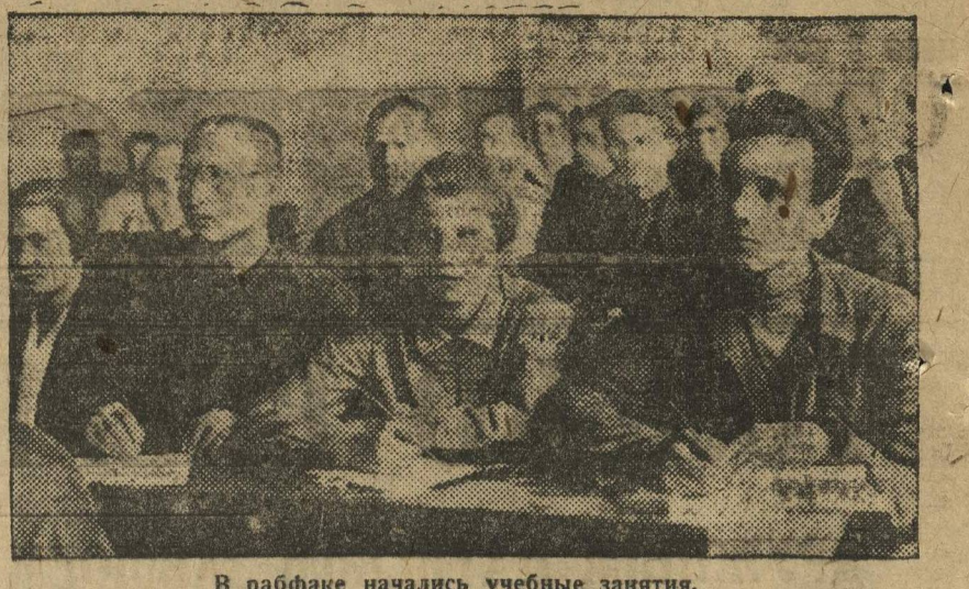
В рабфаке начались учебные занятия.