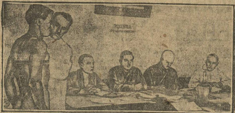
Призыв 1908 года. В Иваново-Вознесенской области начался призыв в ряды РККА, родившихся в 1908 году. На снимке: в призывной комиссии. Осмотр врачей призывника.