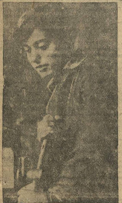
На учбазе Автостроя группа ОЗЕТ служит примером ударной, добросовестной работы. На снимке — ударница из группы ОЗЕТ.

Как сообщают из Лимы (столица Перу) забастовка 15 тысяч горняков на американских медных рудниках Серро де Паско приняла ожесточенный характер. По просьбе американского посла правительство уже выслало в район забастовки 350 солдат с инструкциями «стреляйте, если это необходимо».