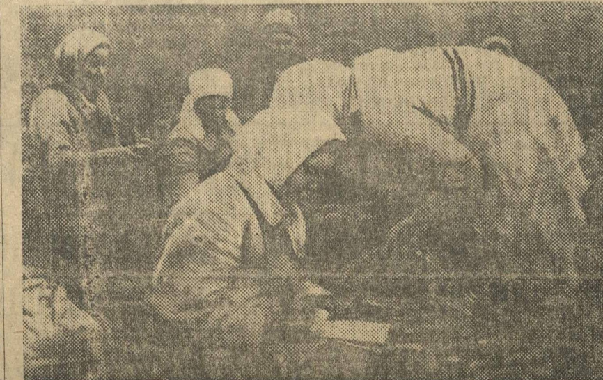
«Колхозники готовят овощи для отправки в город».

Производственная специализация с.х. районов, легко осуществляемая в условиях общественного планового хозяйства, создает чрезвычайно благоприятные условия для широчайшего