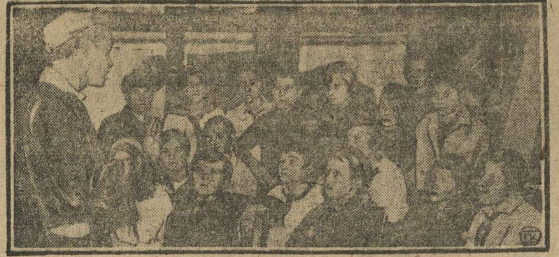
ПИОНЕРЫ—В РЯДЫ ВЛКСМ. В день XVI МЮД в Москве в клубе «Красное Знамя», Павелецкой линии, М.-Курск. ж. д., были переданы из комсомола в партию 24 чел., из пионеров в комсомол—22 чел. НА СНИМКЕ: секретарь базового комсомольского бюро проводит беседу с пионерами, переданными в комсомол.