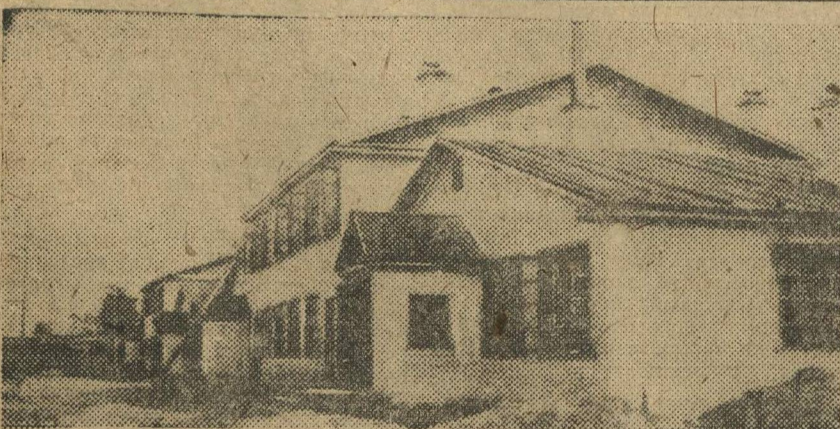
Новые дома для рабочих-сезонников Промстроя в Нижнем-Новгороде.

♦♦ В Таванихинской кустарной артели, Ивановского района, решили на улучшение быта детей выделить 600 р.