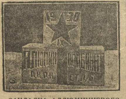
ЗАКЛАДКА АЛЮМИНИЕВОГО КОМБИНАТА (близ Кичкаса).