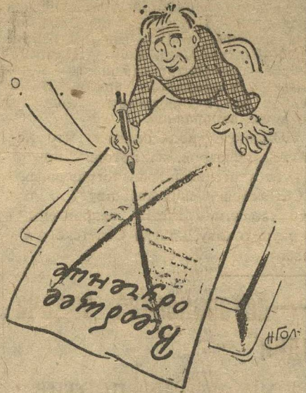
ПО СВОЕЙ НЕГРАМОТНОСТИ СТАВЛЮ КРЕСТ.