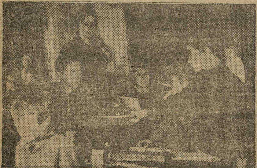
УЧЕБА НАЧАЛАСЬ. (СЕЛО ПЕЧЕРЫ).