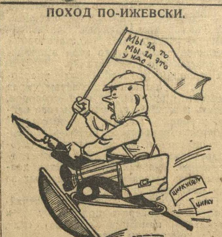
В ИЖЕВСКЕ НА СЛОВАХ И НА БУМАГЕ—ВСЕ, НА ДЕЛЕ—ПОЧТИ НИЧЕГО.

В Гортрамвае комиссия по проверке выполнения рабочих предложений много заседала, но ничего практического не сделала. 170 рабочих предложений до сих пор не проводятся в жизнь, а валяются в папках инженера Гранского. Таким бумажным комиссиям не место в предприятии. Партийная, профсоюзная и комсомольская организации Гортрамвае должны организовать проверку выполнения рабочих предложений. Я.