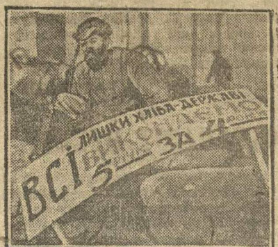
Красные обозы хлеба имени XVI МЮДа (в Киеве).