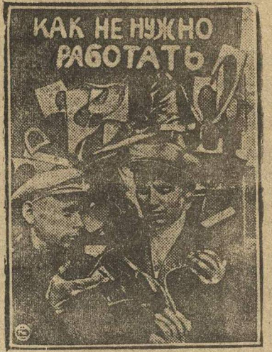
Фабрика «Трудовая коммуна» на буксире ткачей. Рабочие Иваново-Вознесенской текстильной фабрики «Сосновская мануфактура» взяли на общественный буксир обувную фабрику «Трудовая Коммуна». На снимке: витрина из негодных материалов, обнаруженных на фабрике.

10 дней оставшихся до начала третьего года пятилетки должны быть днями героической борьбы за промфинплан. БРИГАДА «ЛЕНИНСКОЙ СМЕНЫ».