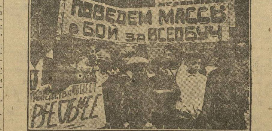
В БОЙ ЗА ВСЕОБУЧ. На днях, в Ростове состоялась большая демонстрация, посвященная походу за всеобуч. На снимке: школьники на демонстрации.

Л. КУДРЕВАТЫХ. С. Гореве, Уреньского района.