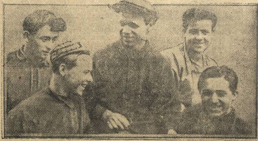
Рабочая комсомольская бригада «Ленинской Смены» в кузнечном цехе на «Красном Сормове».

НА ПОВЕСТКЕ ДНЯ ВОПРОС: «О РЕАЛИЗАЦИИ ОБРАЩЕНИЯ ЦК ВКП(б).