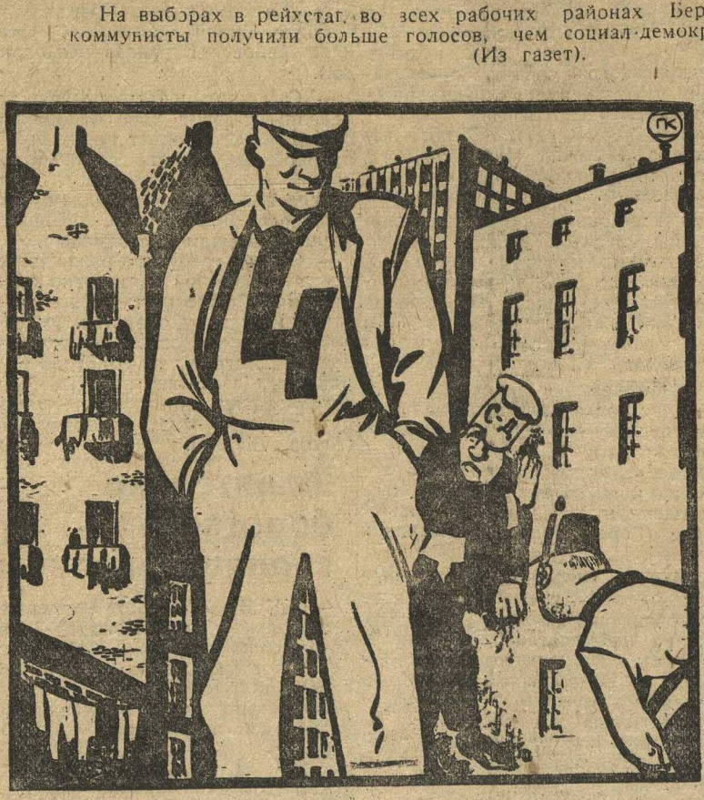
Соц.-дем.: — ПОМОГИТЕ! ВЫЖИМАЮТ!