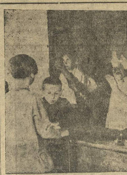
На уроке в сельской школе.

Очень не многое. Чтобы обеспечить 25 проц. детей бедняков нужно иметь в фондах бедноты 2.610.000 руб. По 30 районам на сегодняшний день мы имеем только 189.000 руб.