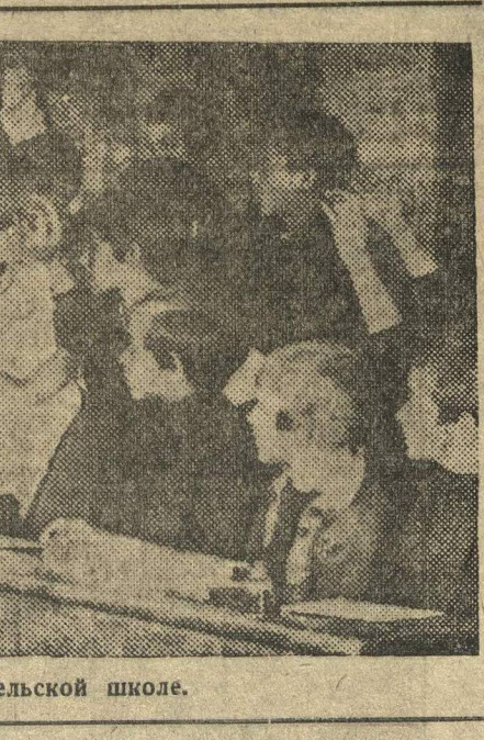
На уроке в сельской школе.

отношением отдельных низовых организаций к делу всеобуча. «Советская Деревня» пишет, что в Городке школьные помещения заняты под общежития, квартиры и даже Центроспирт.