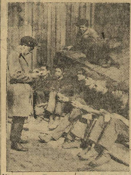
Ударники. Прорабатывают встречный промфинплан.