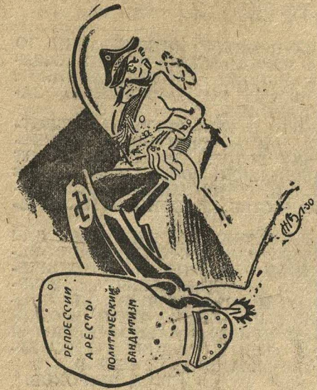
ПИЛСУДСКИЙ.—«Чего моя нога хочет».

В ПОЛЬШЕ. Польша переживает полосу политического бандитизма Пилсудского.