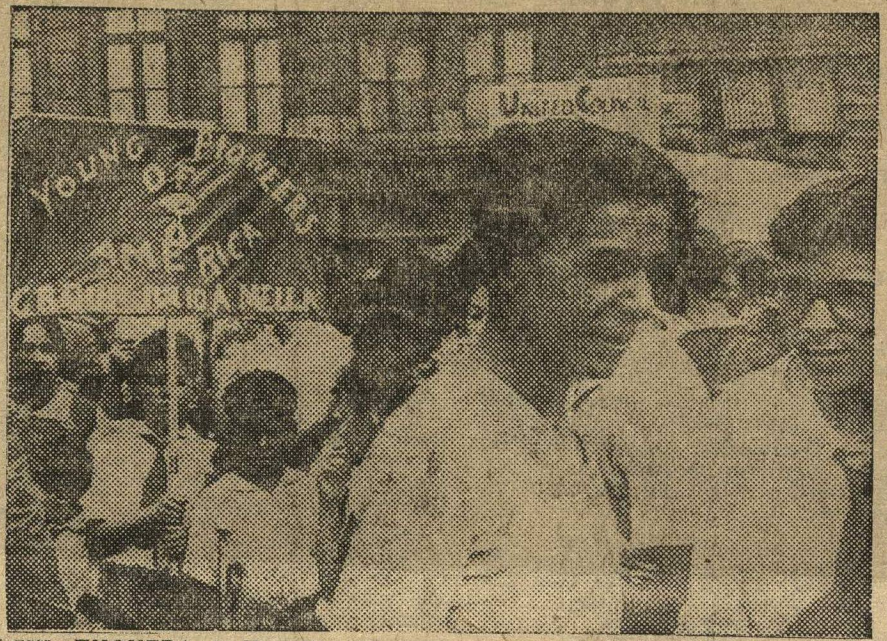
ДЕНЬ ПИОНЕРА. В Нью-Йорке пионерорганизациями был организован День Пионера. На снимке: пионеры на празднике.

У авторов ноты поворачивается язык заявить об обратной выдаче насильственно переброшенных финских рабочих на территорию СССР.