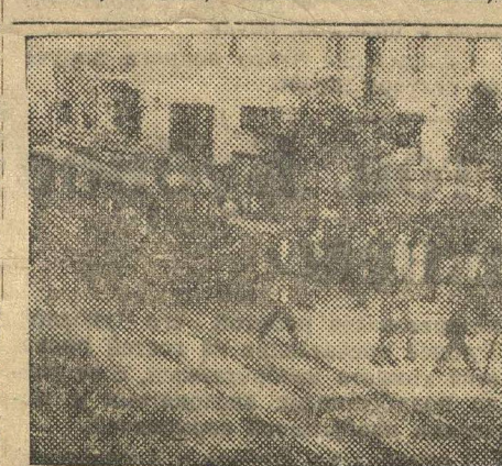
Театральная площадь—центр Н.-Новгорода.

В ассортименте продукции, выпускаемой нижегородскими предприятиями чего-чего только нет. Тут требуется в день 74 литра. А наш ни и кожевенные товары, химические препараты, валенки, расквича. 39 литров, вот суточная норма дио-приемники, телефоны, кондитерские изделия, мыло, растительное масло, бензин, технические масла, водоснабжение города было подъято