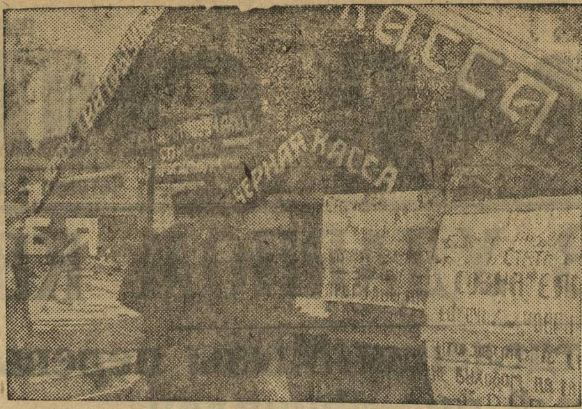
ПРОГУЛЬЩИКАМ—ЧЕРНАЯ КАССА. На Архангельском лесозаводе Северолеса для прогульщиков устроена специальная черная касса, где прогульщики получают зарплату. Такая касса есть в вагоно-механическом цехе «Красного Сормова». На снимке: у черной кассы.

Проводя всю работу — помнить, что кампания самообложения есть важнейшая хозяйственно-политическая кампания, в стороне от которой не имеет права встать ни одна ячейка, ни один комсомолец в деревне. И нужно требовать подлинно боевой работы по самообложению от всех деревенских организаций комсомола.