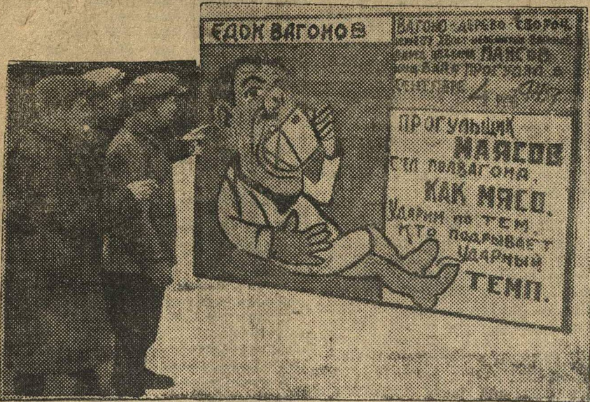
Так в вагоно-дерево-сборочном цехе «Кр. Сормова» рабочие травят прогульщиков.

Темпы работы паровозников, вагонщиков сделаем повседневными!