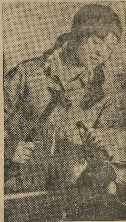
Примерная ученица школы ФЗУ 3-да «Двигатель Революция».

2. В 6 час. вечера (в этом же помещении) о работе КСМ на желез-