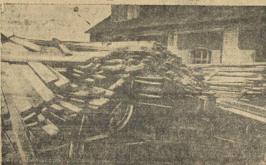
Вместо 15 тонн на платформу кладут 25, а из этого...

...Динь-бринь, динь-бринь, динь-бринь... В руках качается над президиумским столом колокольчик. Кругом знамена, тяжело свисают на стягах.