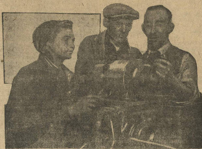
На Сталинградском тракторном заводе американский инженер обучает фабричных.

Культурно-массовая работа совершенно не развернута. С постройкой значимых барачков не торопятся. Начальник 2 дистанции не знает сколько барачков на его участке строится и сколько нужно выстроить. Соревнование и ударничество развернуто очень слабо.