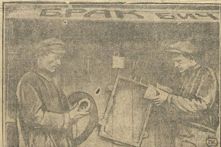
Не работайте так! Ведите решительную борьбу с браком. Ко II краевой конференции, к IX съезду ВЛКСМ покажите наилучшие качественные показатели.