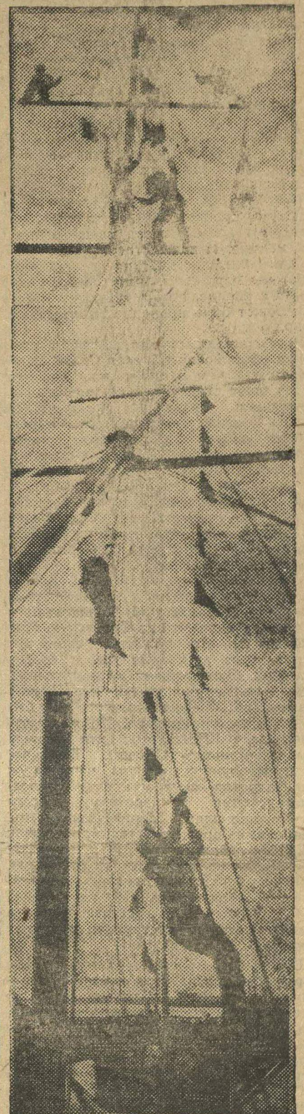
ПЕСНЯ МОРЯКОВ (Черноморский флот).

Октябрьской зачинщице— Ударной „Авроре“ Комсомольский привет Из Нижнего—в море!