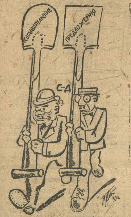
Со старым испытанным инструментом. Рис. Гр. Ст.

«Роте Фане» разоблачает подготовку реформистских профбюрократов к срыву забастовки берлинских металлистов.