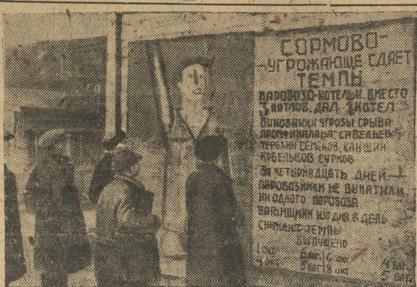
Сентябрьские темпы «Красное Сормово» значительно снизило в октябре. На снимке — плакат с фамилиями виновников срыва темпов и графиком вы-пуска вагонов.

А технический надзор? Он видит и проходит мимо. ФРЕЗ.