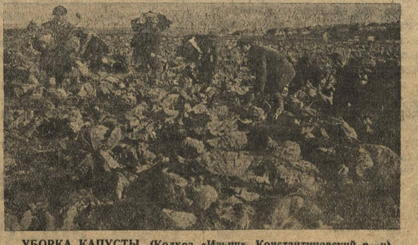
УБОРКА КАПУСТЫ. (Колхоз «Ильич», Константиновский р-н).