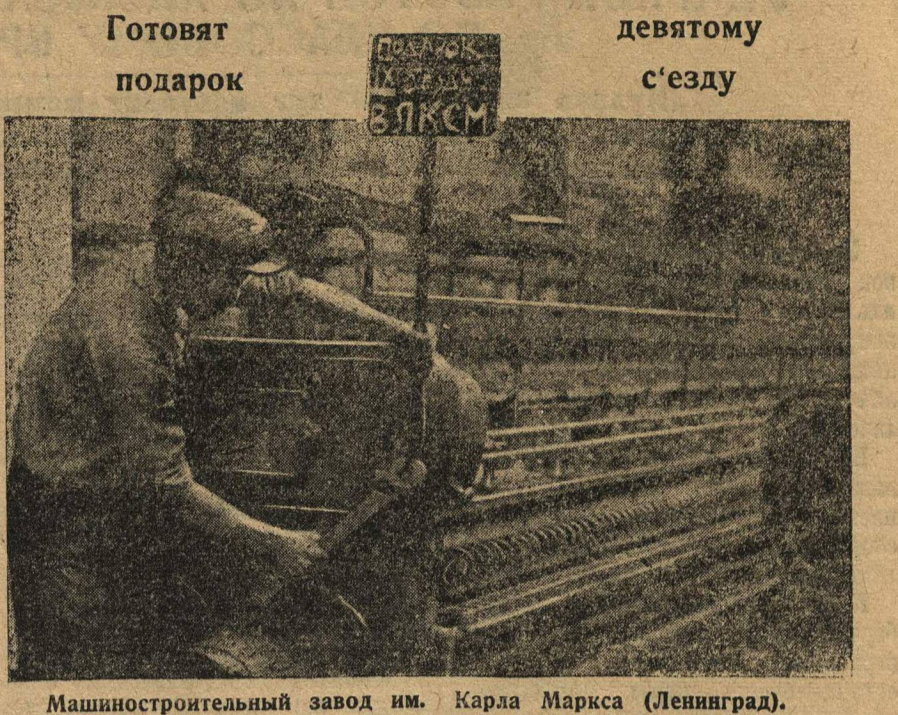
Машиностроительный завод им. Карла Маркса (Ленинград). Завод завоеванное переходящее знамя будет держать крепко