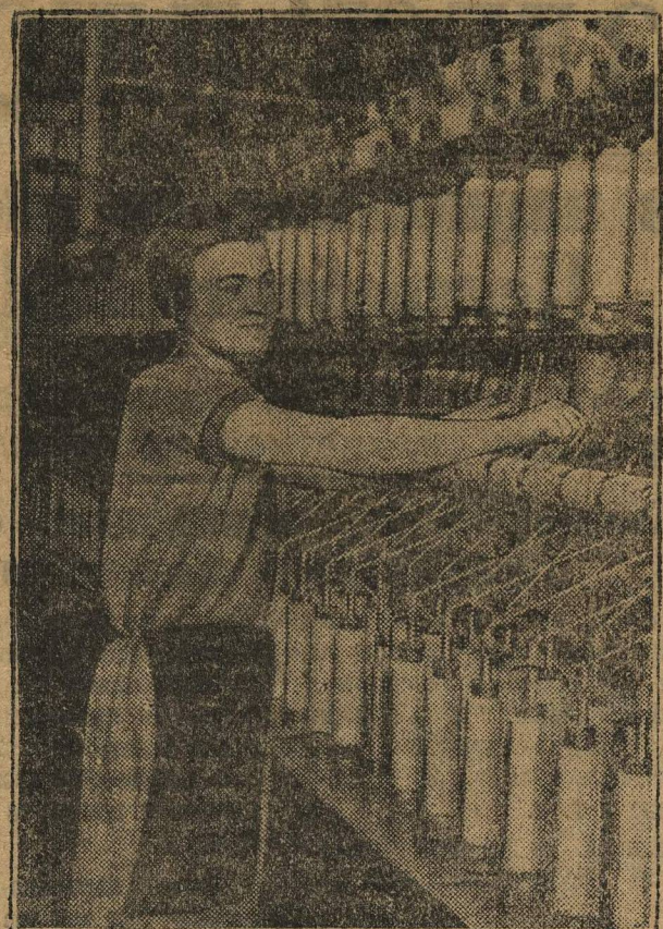
Ученица ФЗУ отделения ткацкой фабрики за станком вадежного

Сколько тысяч листовок кричало: Зайший наш враг тот, Кто делает брак. С каждым новым сентябрьским днем срок выполнения плана хороче, надо заботиться об одном — бить по прорыву и днем и ночью. Листовки раскидывали в заводе, в театре, в Доме Культуры: Котельщик.