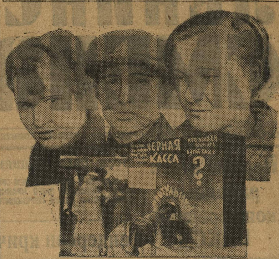
ПОКАЗЫВАЕМ ПРОГУЛЬЩИКОВ. Группа комсомольцев фабзавцев завода «Двигатель Революции», получающих зарплату из черной кассы.