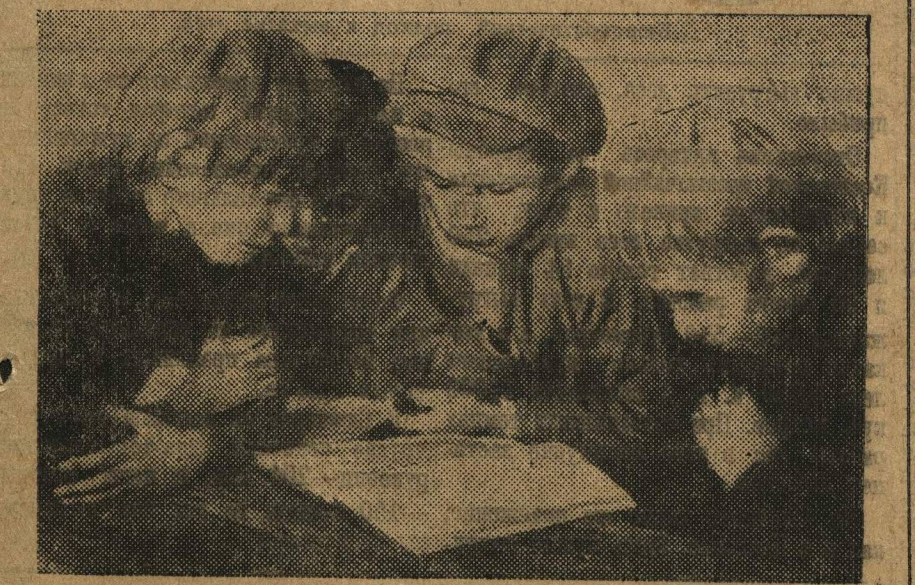
В СЕЛЬСКОЙ ШКОЛЕ. Решают задачу.