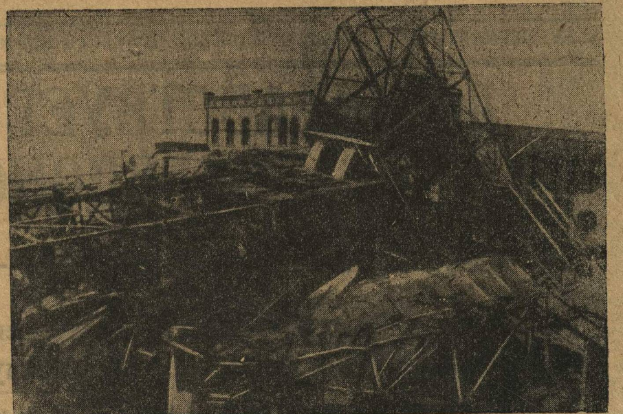
КРОВАВОЕ ПРЕСТУПЛЕНИЕ УГОЛЬНЫХ ВАРВАРОВ. ВЗРЫВ НА ШАХТЕ «ВИЛЬГЕЛЬМ» Рурской области, жертвой которого стало 300 горняков. Этот взрыв является результатом преступной, потогонной эксплуатации шахты капиталистами.

НА СНИМКЕ: Вид на шахту «Вильгельм» после взрыва.