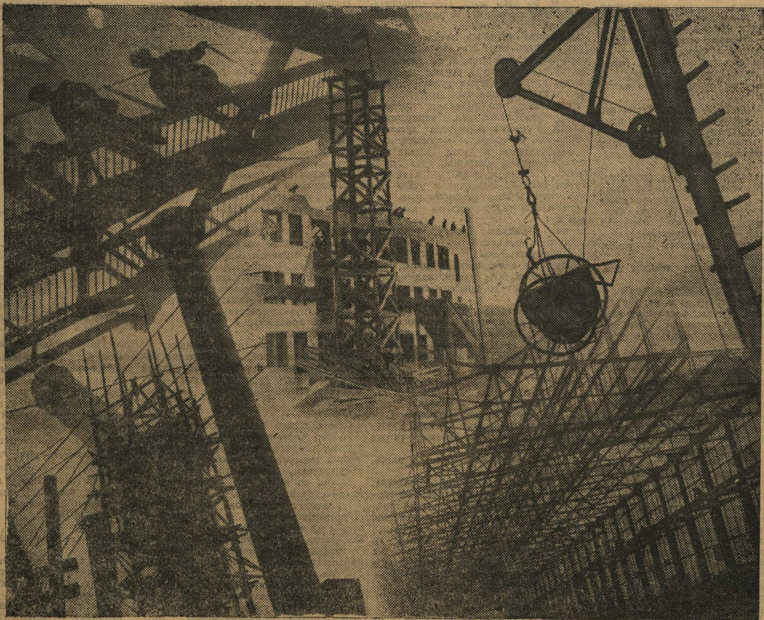
Фото-композиция Н. Капелюш

ВПЕРЕД ЗА БОЛЬШЕВИСТСКИЕ ТЕМПЫ, ЗА СТРОИТЕЛЬСТВО ГИГАНТОВ ПРОМЫШЛЕННОСТИ, ЗА СТРОИТЕЛЬСТВО СОВХОЗОВ И КОЛХОЗОВ!