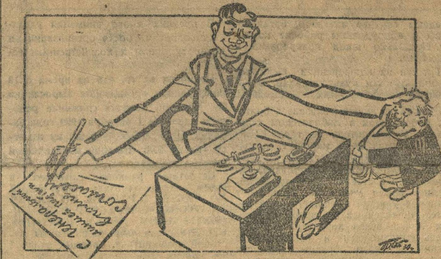
Мастер на обе руки