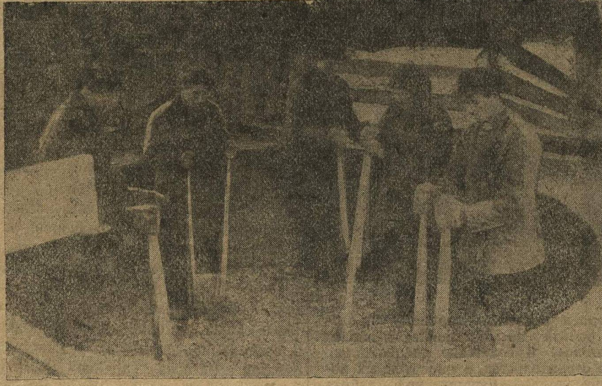
Силосование. Утрамбовка капусты (совхоз, Зименки, Муромск. р.).