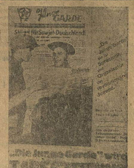
НОВАЯ ЕЖЕДНЕВНАЯ ГАЗЕТА ГЕРМАНСКОГО КОМСОМОЛА «МОЛОДАЯ ГВАРДИЯ». На снимке: плакат, призывающий подписаться на газету.

БЕРЛИН, 15. Сегодня в Берлине вышел второй номер нелегальной газеты «Роте-Штурм-Фане», выходящей вместо закрытой властями «Роте Фане». Номер вышел на нескольких страницах и посвящен в первую очередь проблеме безработицы в Германии.