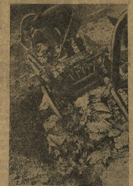
КОЛХОЗЫ НА ПОМОЩЬ РАБОЧИМ ЦЕНТРАМ. На снимке: погрузка капусты в колхозе «Восход» (Муромский район).

Необходимо немедленно ударить по правооппортунистическим настроениям и обломовщине в Н. Торъяльской организации КСМ.