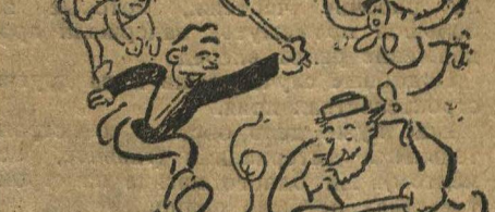
Понимается коммуна, как «ОБЩИЙ КОТЕЛ».

Выделили, но только не две комнаты, а, красный уголок, который обслуживал до этого 400 рабочих-строичуков.