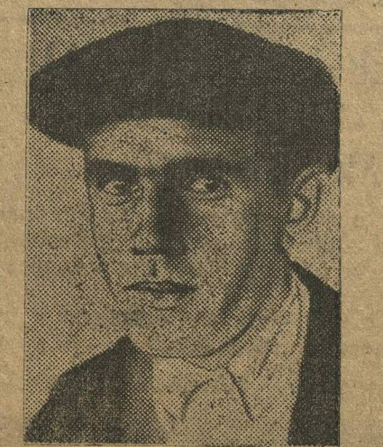
Председатель колхоза «Восход». (Муромский район).