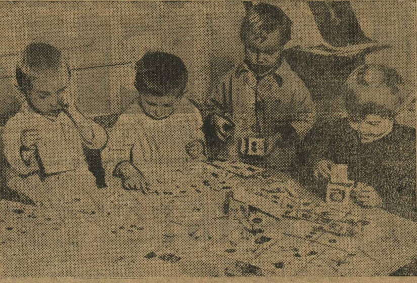
ДЕТСКИЙ САД В КОЛХОЗЕ.

Ячейка комсомола организовала бригаду по вербовке в колхоз