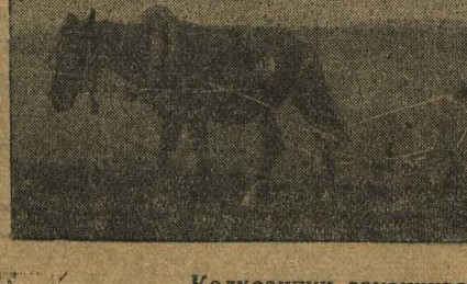
Колхозники заканчивают вспашку под зябь.