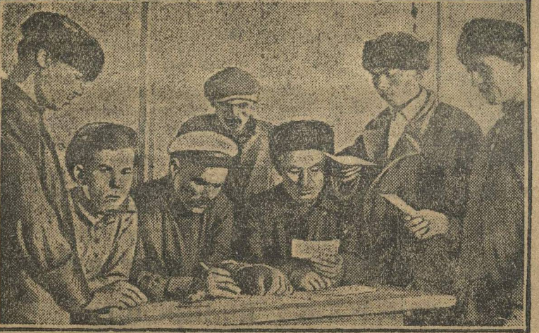
За обсуждением производственного плана во вновь организованном колхозе.

декабрь — март. Конференция поручает «Л. С.» и впредь беспощадно вскрывать все недостатки работы организации края, беспощадно разоблачать оппортунистов всех мастей, особенно правых, непоколебимо бороться за генеральную линию ВКП(б) — ленинизм. КОНФЕРЕНЦИЯ.