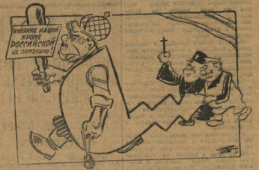
...и его неизменные вдохновители.