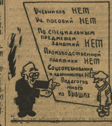
СЕМЕНОВСКИЙ ДЕРЕВООБДЕЛОЧНИК ТЕХНИКУМ, КАК ОН ЕСТЬ.

Взяв шефство, организации должны добиться к IX всесоюзному съезду комсомола устранения в работе подшефных всех прорывов, всех ошибок. Ждем от Канавина, Сормова, Кулебака, Выкса и Муром к 29 ноября ответа на наш вызов. Кто берет шефство? Сообщайте!