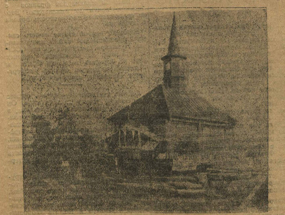
Мечеть, где находится в настоящее время клуб (в дер. Татарском Маклакове, Спасского района).