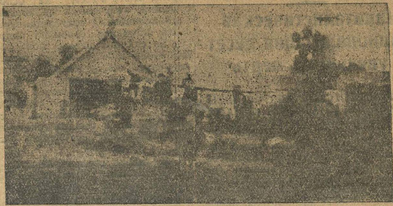
Скотный двор колхоза, строящийся в дер. Татарском Маклакове, (Спасского района).