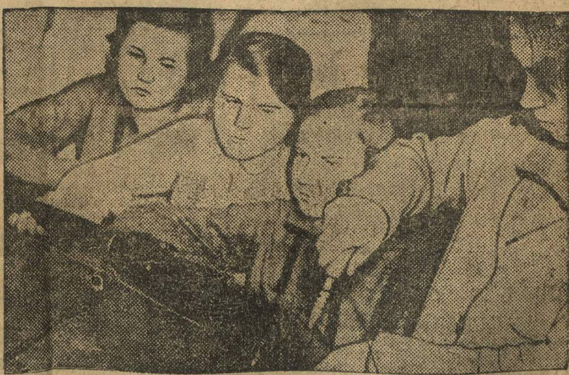
Готовятся к обороне. Изучают винтовку.

В Саксонии, под-бокком у Хемниц, разобрано одно из сел. Фашистские идеи там властвовали нераздельно. Не было в сел ни одного сознательного германской компартии и комсомольца. За кандидатов компартии село в парламент не давало ни одного голоса.