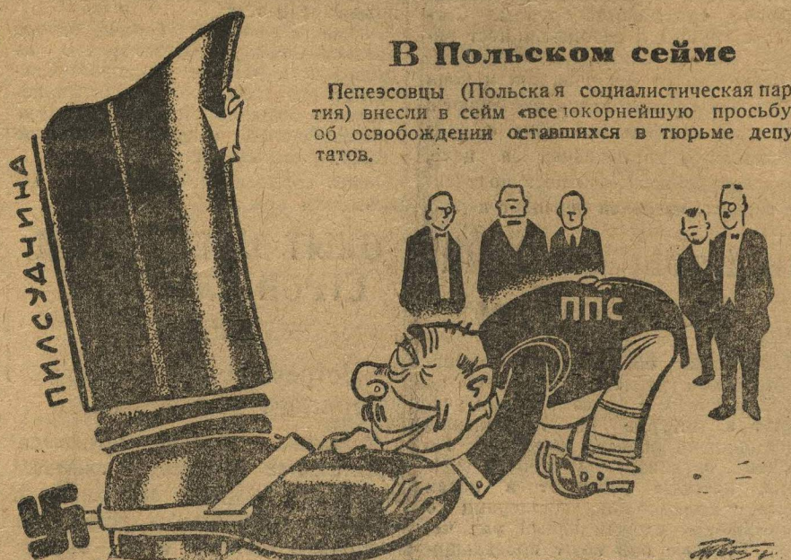
Социалист на всепокорнейшей просьбе

Польский фашизм упорно проводит политику ухудшения национально-освободительного движения трудящихся масс. В Западной Белоруссии особенно усилился кровавый террор фашизма в последнее время. Ночные карательные набеги польских фашистов на белорусские деревни, избиение трудящихся, массовые облавы и обыски на территории всей Западной Белоруссии, истязания трудящихся, все это имеет одну цель — подготовку к будущей войне против СССР. Действенная помощь — в подготовке вооруженного нападения на СССР и, в первую очередь на его фронт — БССР — являются белорусские наци-