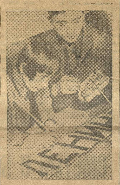
Пионеры готовятся к перевыборам советов. НА СНИМКЕ: пишут плакаты.

Пионеры делают налеты на неиспользуемые станки, оборудование и т. д.