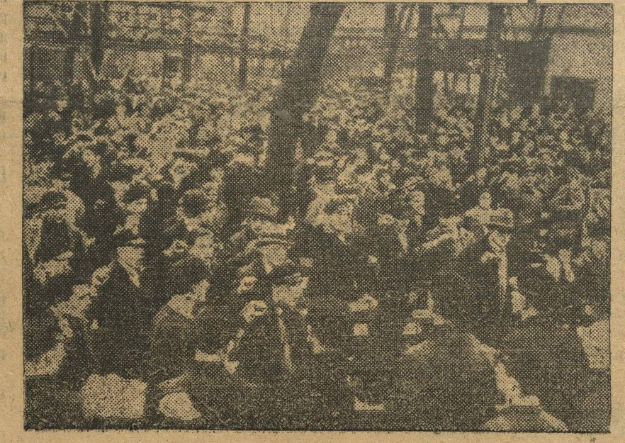
На днях в Берлине состоялось многолюдное собрание рабочей молодежи, организованное комсомолом. Собрание вынесло резолюцию, в которой требует суровой расправы с вредителями. НА СНИМКЕ: общий вид митинга.

Видя эти громадные достижения, я не могу пройти без глубочайшего возмущения, мимо раскрытой контрреволюционной белорусской национал-демократической группы, которая стремилась превратить Советскую Белоруссию в колонию польского фашизма.